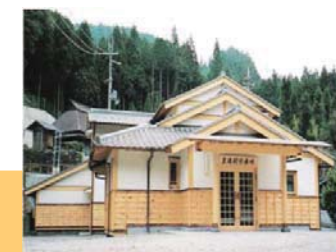
黒滝村国民健康保険診療所