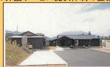
須坂市 地域密着型特別養護老人ホーム