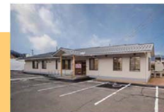
廿日市市吉和診療所

奈良県吉野郡黒滝村 黒滝村国民健康保険診療所 (医療施設等設備整備費を活用し、医療機器を整備) など