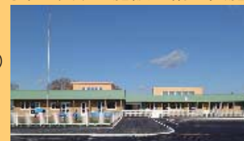
中川町子育て支援センター「まめちょ」