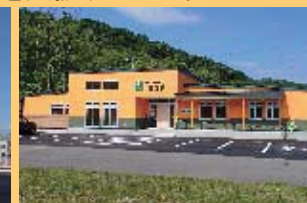
観光・子育て支援センター里住夢