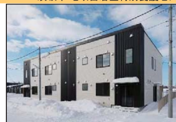
共同生活援助事業所 らいふ